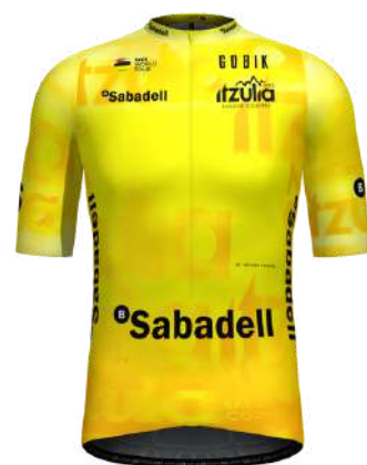
JONAS VINGEGAARD JUMBO VISMA