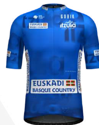
BRANDON MCNULTY UAE TEAM EMIRATES