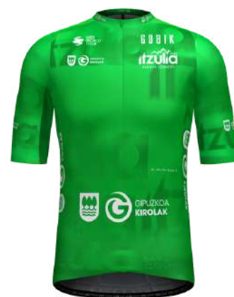
JONAS VINGEGAARD JUMBO VISMA